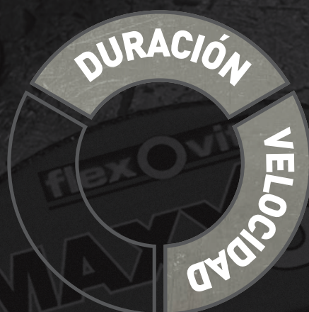
Disco Cerámico Flexovit Convencional