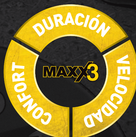
Discos Cerámico Flexovit Maxx3