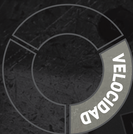
Disco Zirconio Flexovit